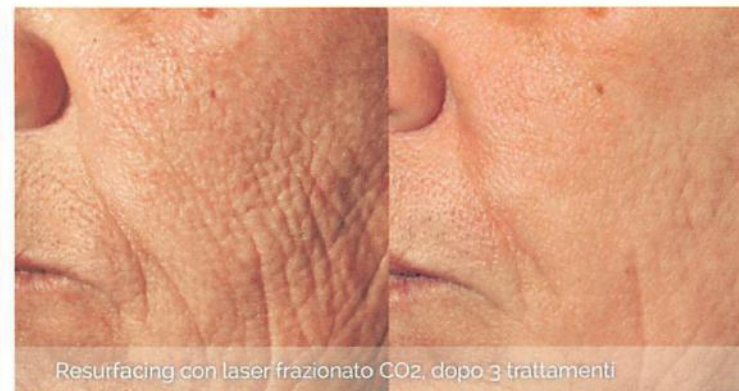
Resurfacing con laser frazionato CO2, dopo 3 trattamenti